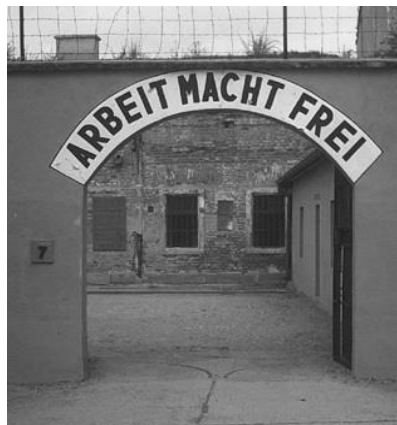
מבט לשער הכניסה לטרייזנשטאט

העיר הקטנה טרייזנשטאט, המוקפת בחומות, במחוז בוהמיה – מורביה הקרוב מאד לגבול הרייך נראתה כפתרון המתאים ביותר למטרות אלו.